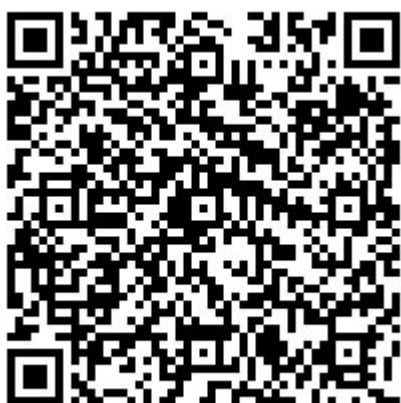
De qr-code van de molen De Liefde.

Deze code kan met behulp van een modern mobieltje, met een camera, worden gescand, waarna de code wordt omgezet in enige informatieve tekst. De hierin voorkomende url kan middels het internet verbinding maken met de website van de molen De Liefde .