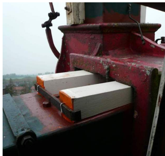
De nieuwe wiggen in de askop.

In het gevlucht van de molen zitten 94 houten kleppen. Dat ook deze onderhevig zijn aan weer en wind is inmiddels duidelijk te zien. Twee ervan waren dusdanig versleten, dat ze nu zijn vervangen.