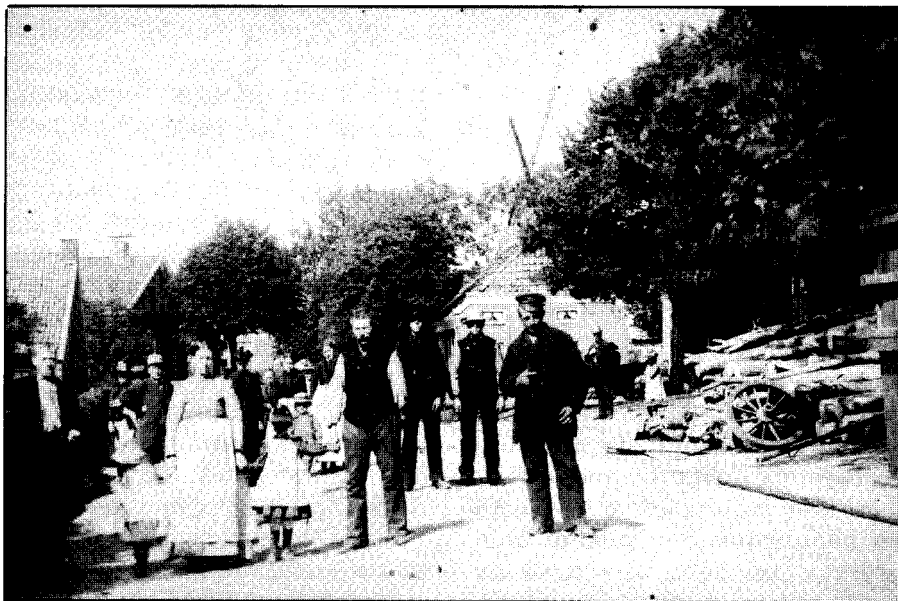
De Uiterburen te Zuidbroek. Boven het huisje zijn tussen de bomen door de kap en wieken van de molen zichtbaar. Deze foto is waarschijnlijk voor 1884 genomen.

De molenaar en zijn vrouw werden door collega's van Frank gefotografeerd. Samen met de oude meelzakken vormen zij nog de enige herinneringen aan de molen van de Uiterburen.