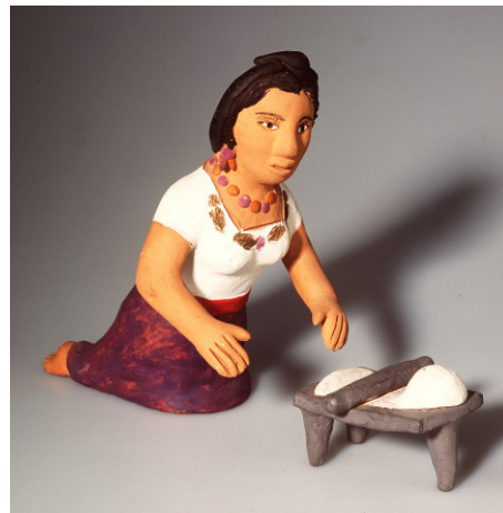
Zapoteekse vrouw met wrijfsteen (molensteen).