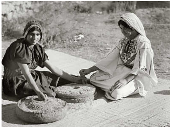
Arabische vrouwen met handmolens (kweern).

Gedenk dan uw Schepper in uw jongelingsjaren, voordat de kwade dagen komen en de jaren naderen, waarvan gij zegt: Ik heb daarin geen behagen; voordat de zon verduisterd wordt evenals het licht en de maan en de sterren en de wolken na de regen wederkeren; op de dag, dat de wachters van het huis beven en de sterke mannen zich krommen, en de maalsters ophouden, omdat haar aantal gering geworden is, en zij, die uit de vensters zien, hun glans verliezen, en de deuren naar de straat gesloten worden; als het geluid van de molen verzwakt, en de stem hoog wordt als die van een vogel en alle tonen gedempt worden;