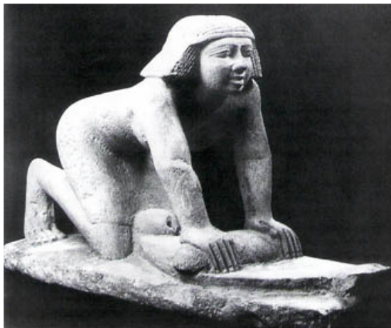
Egyptische vrouw met wrijfsteen (molensteen).

NBG-vertaling 1951 © Nederlands Bijbelgenootschap, Haarlem