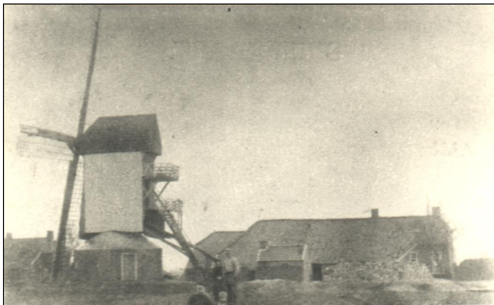
Afb. 5. Een gesloten standerdmolen met twee balkons, naast een Oldambtster boerderij. Deze molen werd in 1857 van Winschoten naar het gehucht Hoorn bij Wedde verplaatst en had een vlucht van 72 voet. De foto moet omstreeks 1900 zijn gemaakt.