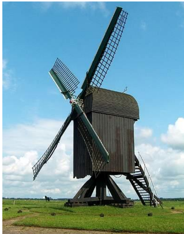
Afb. 7. De standerdmolen te Ter Haar.