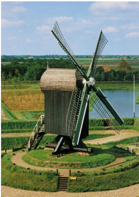
Afb. 6. De Vestingmolen te Bourtange.