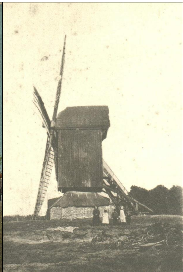
Afb. 2. De standerdmolen te Vriescheloo. Gebouwd in 1831, afgebroken in 1909.