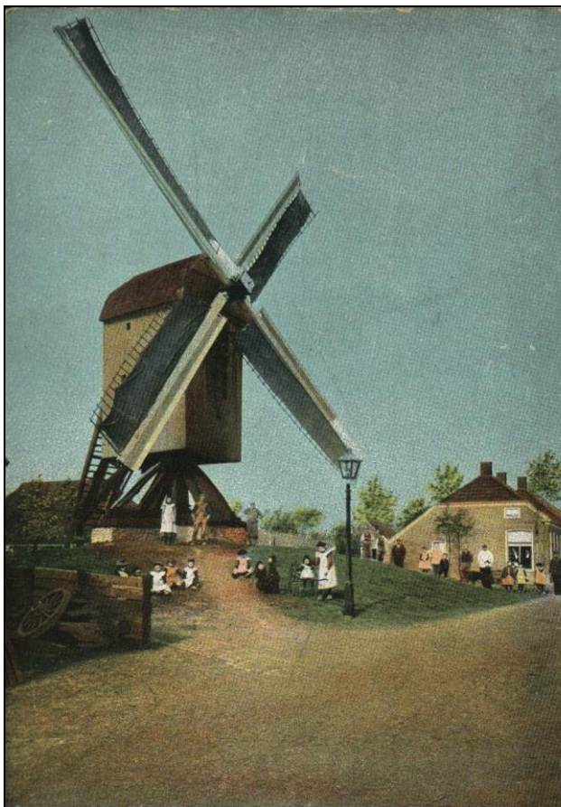
Afb. 1. De standerdmolen te Zuidhorn. Eerste vermelding vóór 1406, afgebroken in 1910.