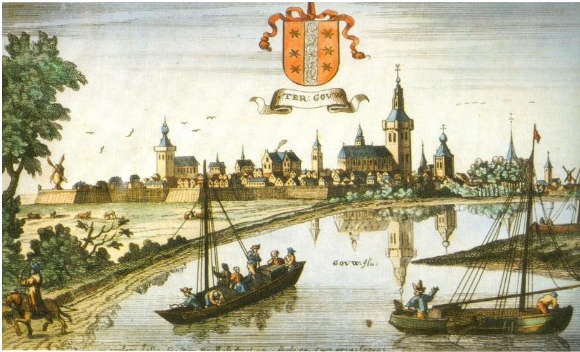
Gezicht op Gouda (Ter Gouw) in 1674. Gravure van Gaspar Bouttats naar een tekening van Johannes (Jan) Peeters.