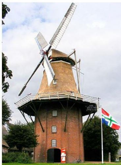
en de verdwenen molens te Kantens