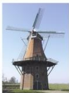
Molen 'De Hoop' te Middelstum