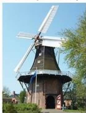
De koren- en pelmolen De Liefde

Aantal pagina's 298, uitgave in eigen beheer, Uithuizen 2004 ISBN 90-808503-1-4, € 17,50