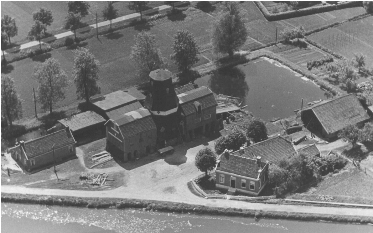
De onttakelde houtzaag- en korenmolen “De Vriendschap” tussen 1920 en 1954. Deze luchtfoto is waarschijnlijk gemaakt door een Engelse piloot in 1945.

Lemminga kocht in die tijd voornamelijk iepenbomen voor de verwerking van stelmakershout (boerenkarren en wagens), terwijl tevens in opdracht werd gezaagd. Zo konden boeren of wagenmakers, die één of meerdere bomen gezaagd wilden hebben, bij de molen terecht. Na verloop van tijd konden de planken tegen zaagloon worden afgehaald. Behalve met drie zaagramen was de molen in die tijd uitgerust met twee koppels stenen. Hiermee werd gerst en mais gemalen en als veevoer in de omtrek verkocht.