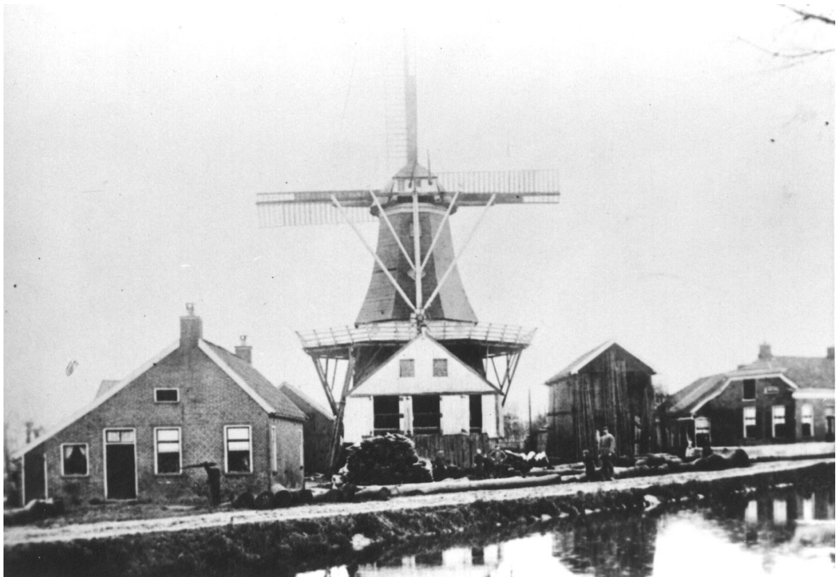
“De Vriendschap” was een achtkante stellingmolen te Eexta, gemeente Scheemda aan het Winschoterdiep met twee functies, n.l.: houtzaagmolen met drie zaagramen en korenmolen met twee koppels maalstenen. Gebouwd 1841, onttakeld 1920 en gesloopt 1954.