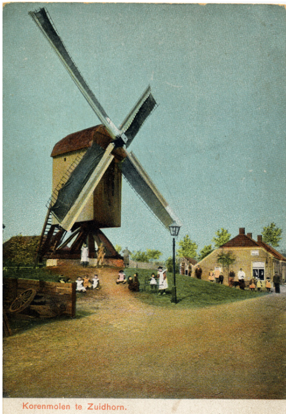
Korenmolen te Zuidhorn.

Een bij uitstek geschikte plek om daarnaar te zoeken is in het Groninger Molenarchief te Veele, waar in meerdere bronnen naar de informatie kan worden gezocht.