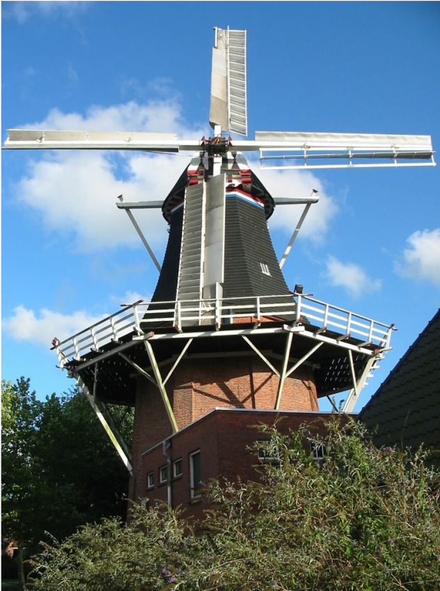
Oldehove de koren- en pelmolen “De Leeuw”, met het dekkerwieksysteem voorzien van de bremer-remkleppen en op de andere roe het Ten Have-systeem.