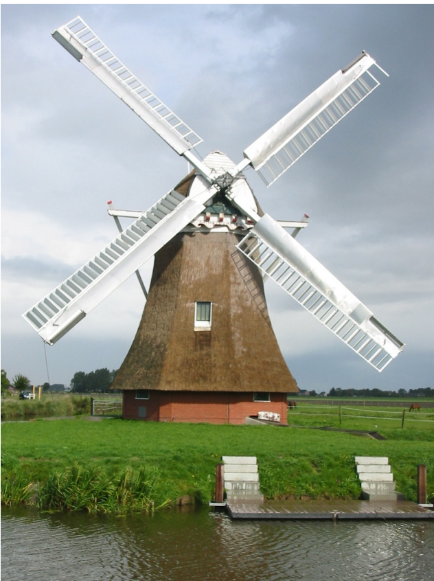
Zuidwolde De “Krimstermolen”, een poldermolen met het dekkerwieksysteem voorzien van de bremer-remkleppen.