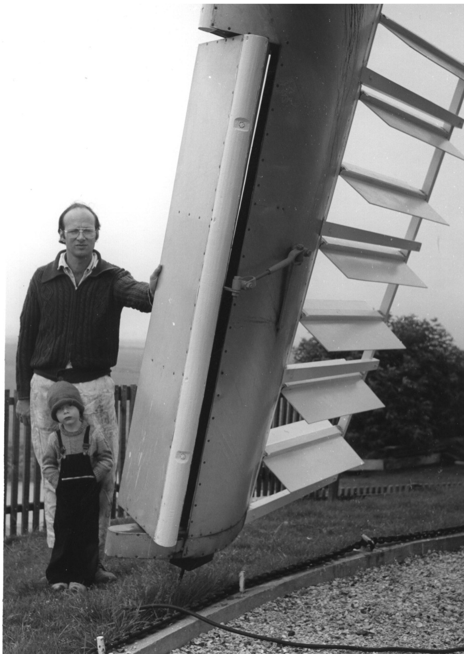
Een dekkerwiek voorzien van de bremer-remklep op de poldermolen De Biks te Onnen.

Na 1945 heeft de fa. Bremer veel wieken gestroomlijnd volgens het systeem Van Bussel. Zij werden voorzien van de bremer-remkleppen.