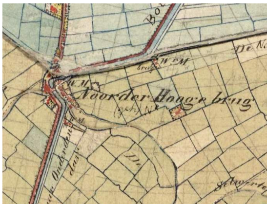
Afb. 1. Het deel uit de Topographische Militaire Kaart van het Koninkrijk der Nederlanden (TMK - verschenen tussen 1850 en 1864), toont de situatie te Noorderhoogebrug, waar toentertijd ook nog enige watermolens stonden.

Concreet ging het om 87 bomen die langs de weg naast het Boterdiep stonden. De molen betreft de in 1843, ter vervanging van een afgebrande voorganger, gebouwde koren- en pelmolen, die op 22 oktober 1906 eveneens afbrandde en werd vervangen door de huidige molen 'Wilhelmina'.