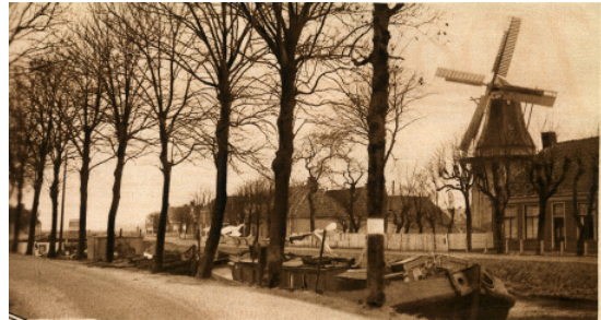
Afb. 3. De molen Wilhelmina aan het toen nog niet gedempte deel van het Boterdiep.

voldoen door mij te machtigen de bedoelde boomen ter hoogte van 7,50 M boven den grond te doen inkorten ... mits adressanten zich vooraf verbinden om de kosten van aftopping nu en voor het vervolg, voor hunne rekening te nemen."