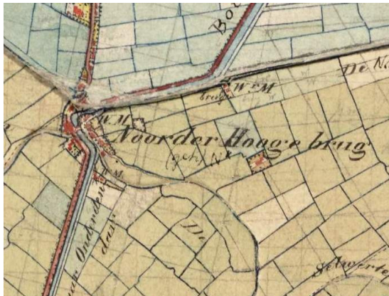
Afb. 1. Het deel uit de Topographische Militaire Kaart van het Koninkrijk der Nederlanden (TMK - verschenen tussen 1850 en 1864), toont de situatie te Noorderhoogebrug, waar toentertijd ook nog enige watermolens stonden.

Concreet ging het om 87 bomen die langs de weg naast het Boterdiep stonden. De molen betreft de in 1843, ter vervanging van een afgebrande voorganger, gebouwde koren- en pelmolen, die op 22 oktober 1906 eveneens afbrandde en werd vervangen door de huidige molen 'Wilhelmina'.