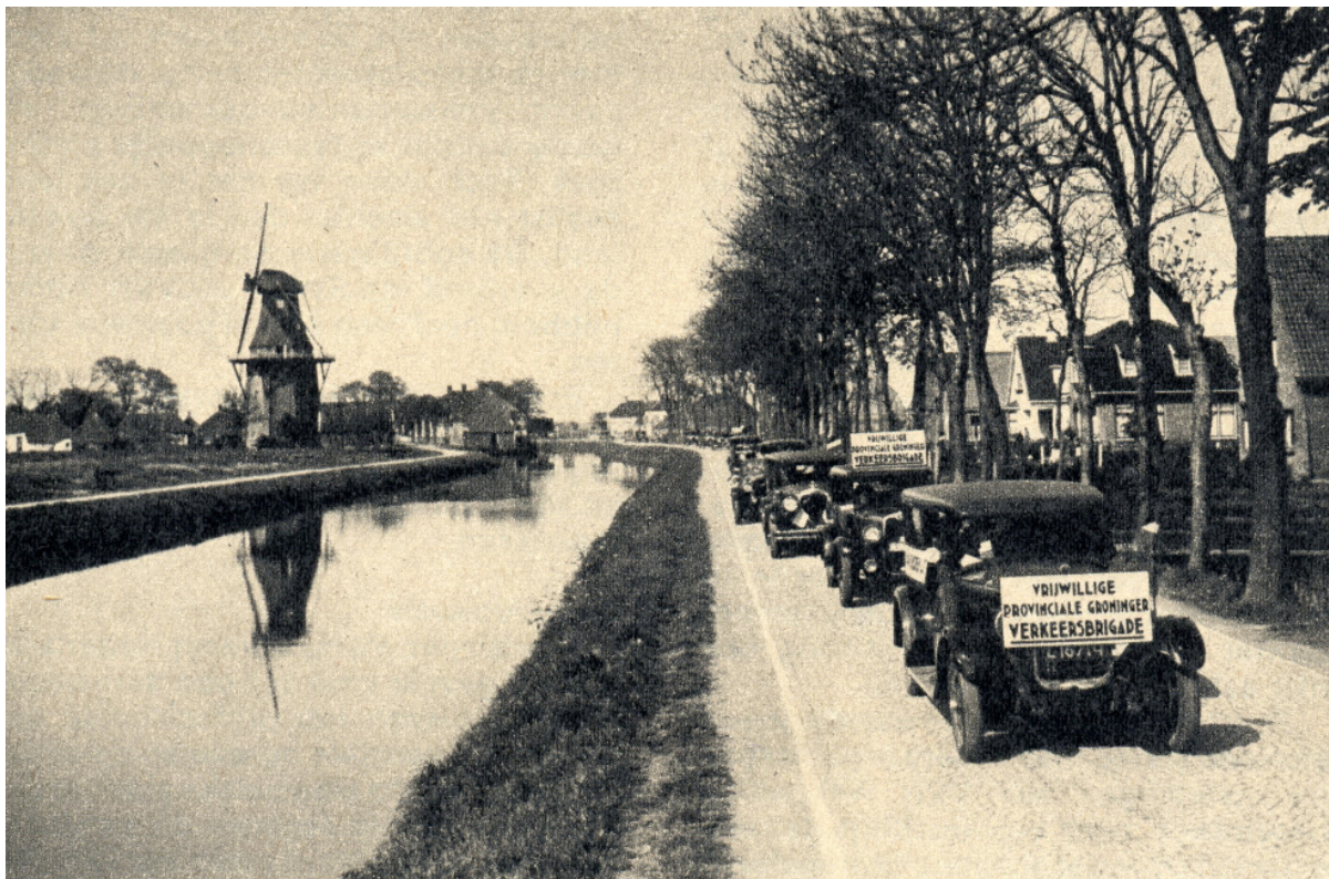
De molen 'Wilhelmina' aan het Boterdiep in 1931.

Transcriptie B. D. Poppen © Uithuizen 26-2-2010