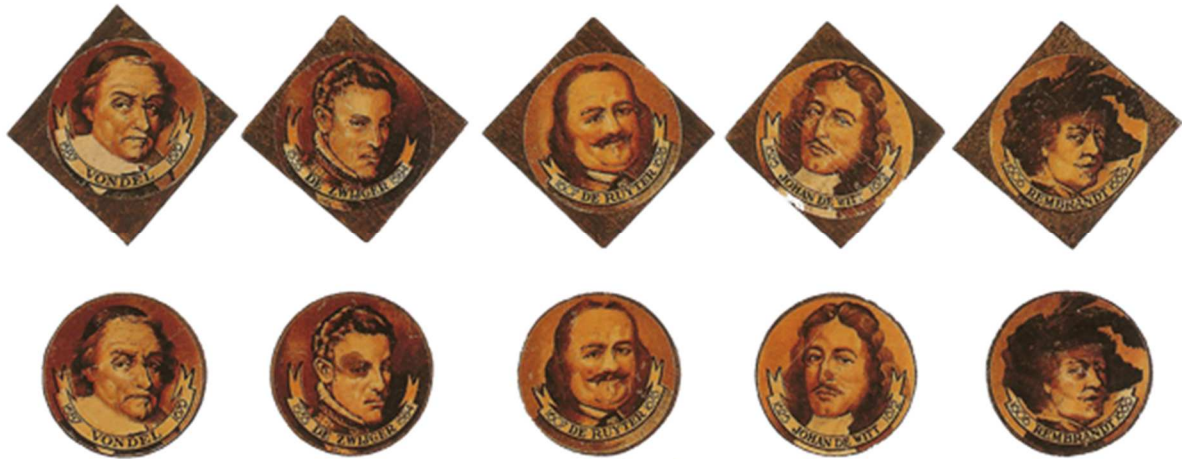
Historische figuren, een papieren plaatje geplakt op hout.

Aanvankelijk hadden de collectes een vrijblijvend karakter, doch geleidelijk werden ze steeds minder vrijblijvend, zo werd er gecontroleerd of iemand gaf en hoeveel.