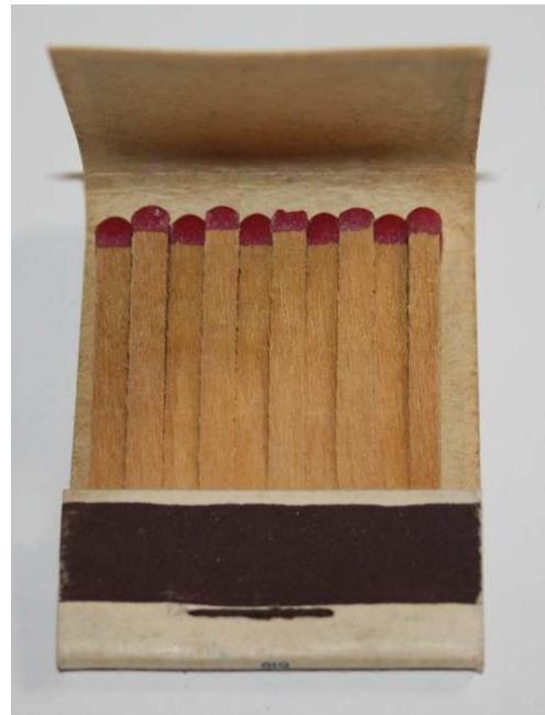
Lucifers in mapjes met Nederlandse en Franse taalopdruk.