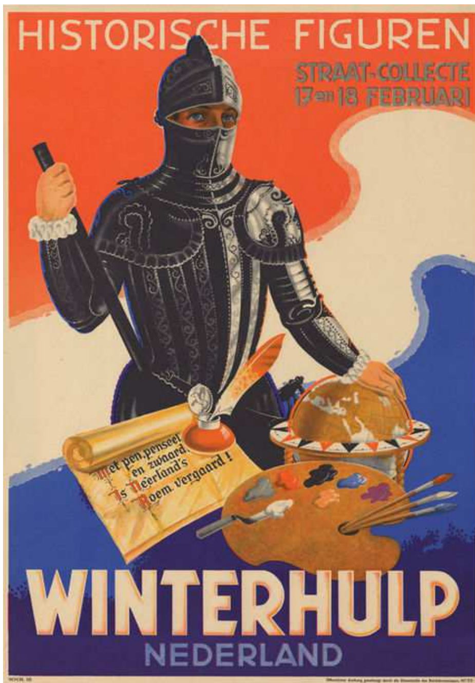
De affiche voor de collecte op 17 en 18 februari 1942, steendruk lithografie.

De collectes begonnen elk jaar in oktober en duurden tot april.